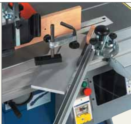
Anlegget med fastklemming for sikkert feste.