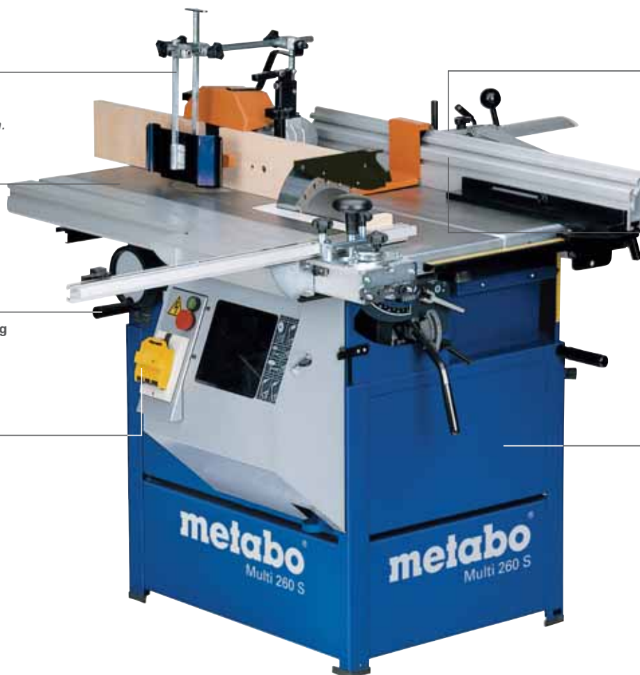
Multi 260 S som bordsirkelsag med standard hardmetall-sagblad og glideanlegg.

Sveiset understell for høyeste presisjon og stabilitet.