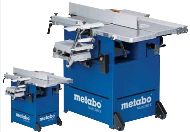
MULTI 260 S - W