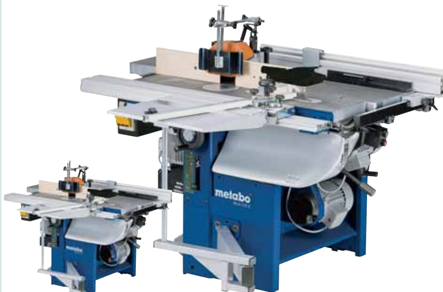
MULTI 310 G - W