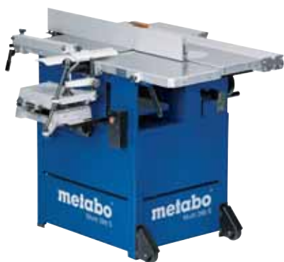
Multi 260 S som avretter- og tykkelseshøvel eller som bordfres med innretning for boring av avlange hull.