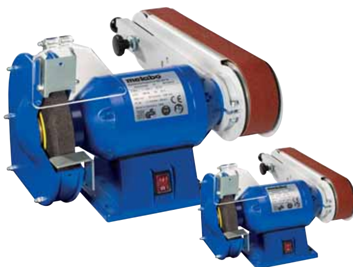
BS 200 W