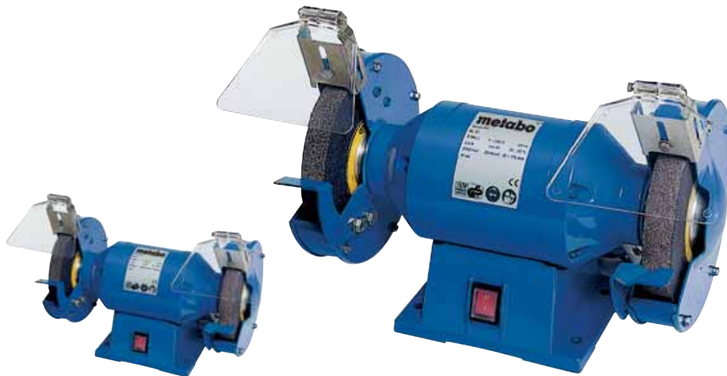
DS 200/25 W