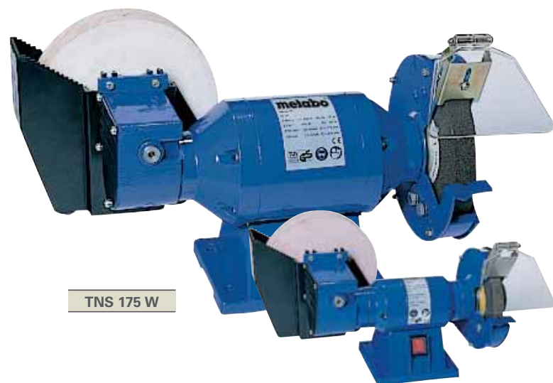
TNS 175 W