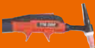
TTK 130 F Fleksibel hals

Alle tilkoblinger er elektrisk isolerte og kan festes uten verktøy. Plastkomponentene har også blitt utformet for å motstå sprut og stråling ved buesveising. Kontrolltilkoblingen overholder MIL-standardene.