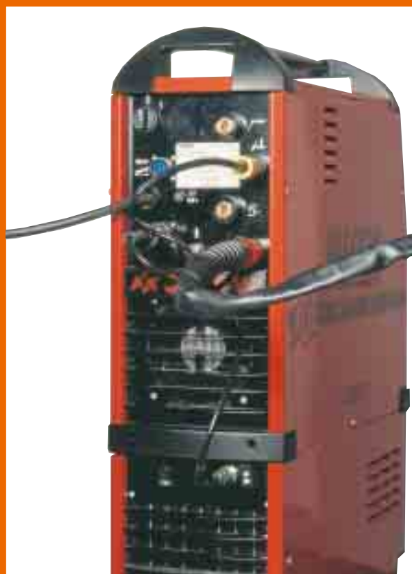
"TTK koblet til Mastertig AC/DC 2500W"