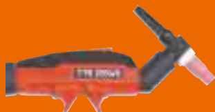
TTK 250 WS S-hals