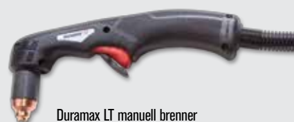
Duramax LT manuell brenner