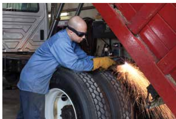
Reparasjon og modifikasjon av biler