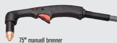
75° manuell brenner

(flere brennervalg finnes på www.hypertherm.com )