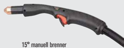
15° manuell brenner